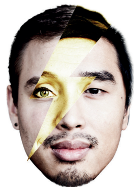
'Om te kunnen werken met goede ideeën ben ik niets zonder Die Mannschaft van Achtung!'