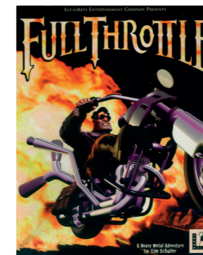
'Fantastische gameklassieker van Lucas Arts.'

www.achtung.nl www.jortschutte.nl www.ilovenewwork.com