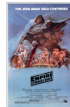
'1980-the-empire-strikes-back-poster! George Lucas: Star Wars.'